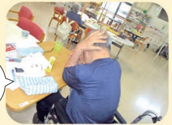
お風呂あがりに整髪