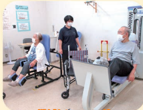
機械トレーニング