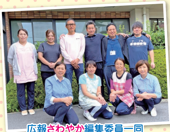
広報さわやか編集委員一同