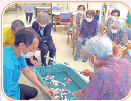
金魚釣り大会の様子

コロナ感染に気を付けながら、少人数でのレクリエーションも行っています。頭と身体を使ってコグニサイズを楽しく取り組んでいただいています。