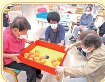
ボール転がしゲーム