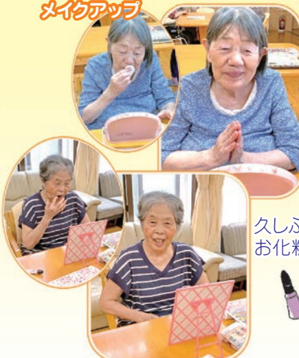
久しぶりのお化粧です

童心に戻れたり、昔の記憶を刺激するようなレクリエーションを考え楽しんでいただいています。