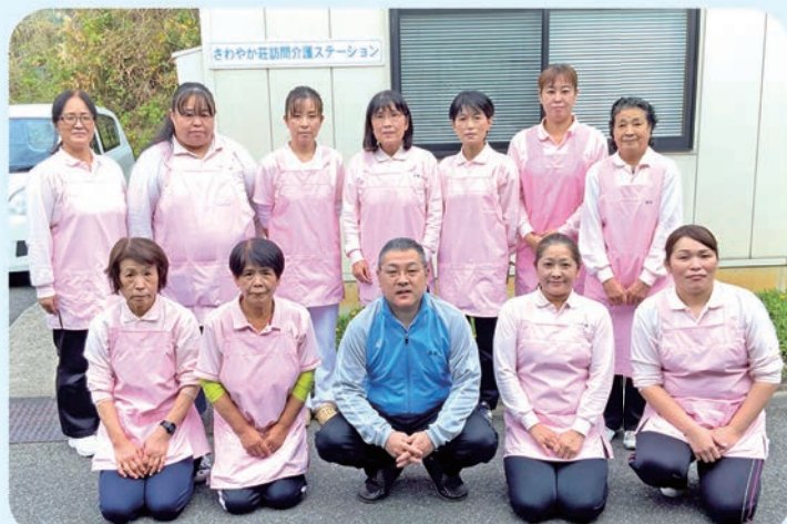
平成12年開設 訪問介護員10名(うち介護福祉士6名)