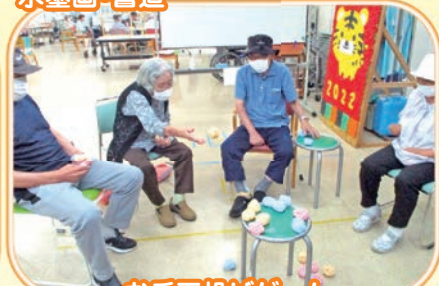
お手玉投げゲーム