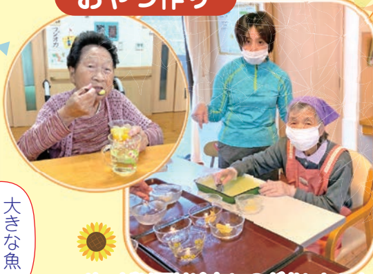
やっぱり夏は冷たいのがおいしいね